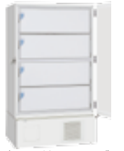
MDF-9ID (2セット) 取り付けイメージ

・メーカー希望小売価格:110,000円 (税別) 小内扉2枚セット (すべてを小内扉にするには2セット必要です) 小内扉を取付けた場合、貯蔵ラックは MDF-20SR1が4段となります