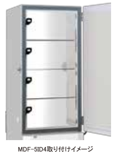
MDF-5ID4取り付けイメージ