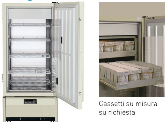
Cassetti su misura su richiesta