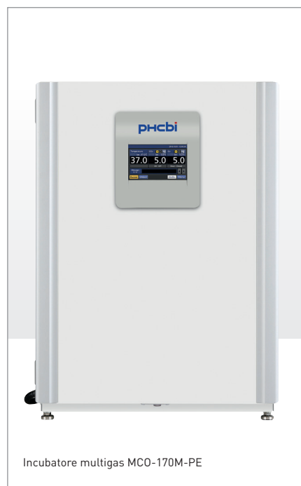
Incubatore multigas MCO-170M-PE